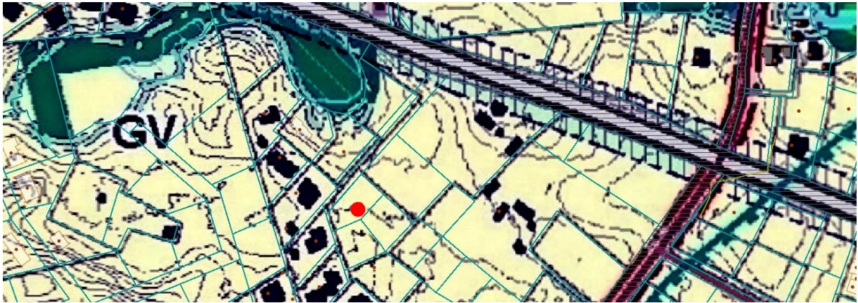
2 pav. Ištrauka iš Vilniaus rajono savivaldybės teritorijos vystymo funkcinio zonavimo brėžinio ● nagrinėjamo žemės sklypo vieta

Žemės sklypo statinių statybos zona ir statybos riba didinama į šiaurės - vakarų pusę iki pakoreguotų inžinerinių tinklų servitutų ribos, Rūtų gatvės. Minimalus atstumas sklype Nr. 3 nuo pravažiavimo (Rūtų g.) – 3.5 m.