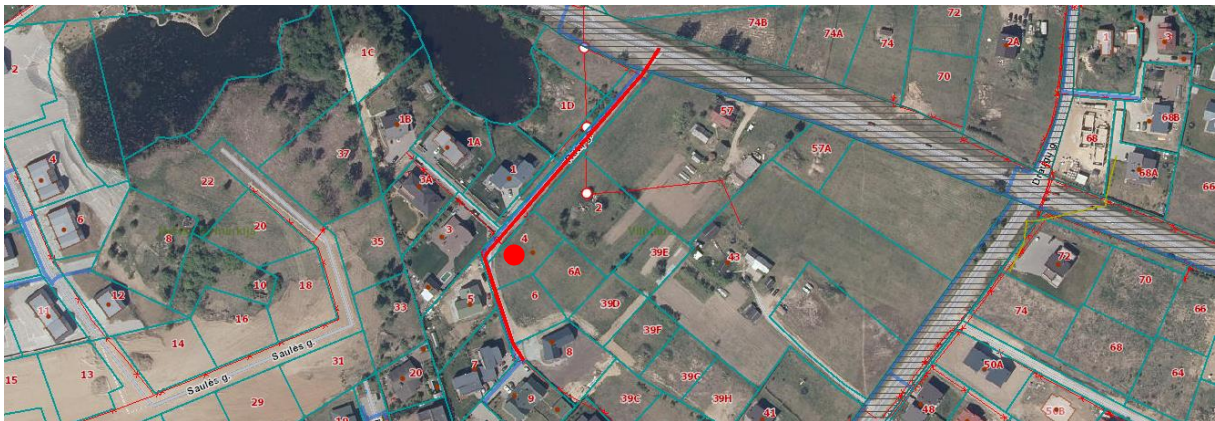
1 pav. Situacijos schema. ● - nagrinėjamas sklypas

Detalusis planas įregistruotas LR teritorijų planavimo dokumentų registre www.tpdr.lt , (reg. Nr. T00080954).