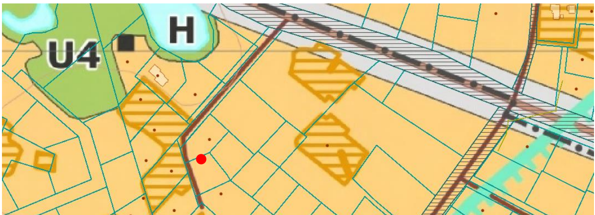
3 pav. Ištrauka iš Vilniaus rajono savivaldybės teritorijos kraštovaizdžio specialiojo plano ● nagrinėjamo žemės sklypo vieta

Detalioju planu nustatyti statybos reglamentai ir teritorijos tvarkymo bei naudojimo režimo reikalavimai (leistinas pastatų aukštis, leistinas sklypo užstatymo tankumas ir intensyvumas) nekeičiami. Sklypas nepatenka į Gamtinį karkasą.