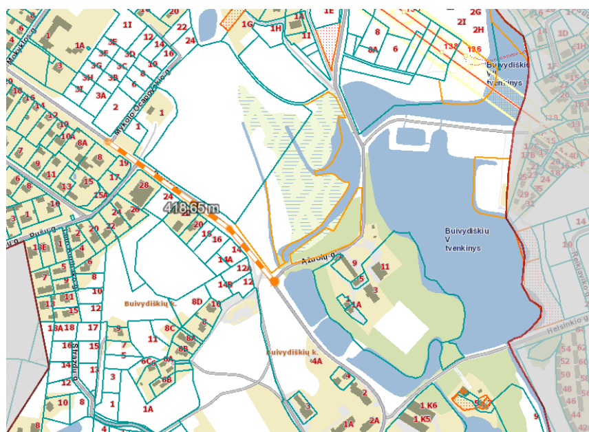
1 pav. Vandens šaltiniai, nutolę iki 1 km nuo nagrinėjamo objekto

Artimiausias priešgaisrinio gelbėjimo pajėgų padalinys – Vilniaus Apskritis Priešgaisrinė Gelbėjimo Valdyba, 1-oji KOMANDA, Rolando Jankausko g. 2/ L. Asanavičiūtės g. 28, LT-04310, VILNIUS. Atstumas – 5,86 km, atvykimo laikas – 10 min (2 pav.).