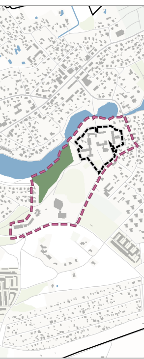
PLANUOJAMA MIESTO TERITORIJĄ MOLĖTŲ MIESTO KONTEKSTE M 1:20000