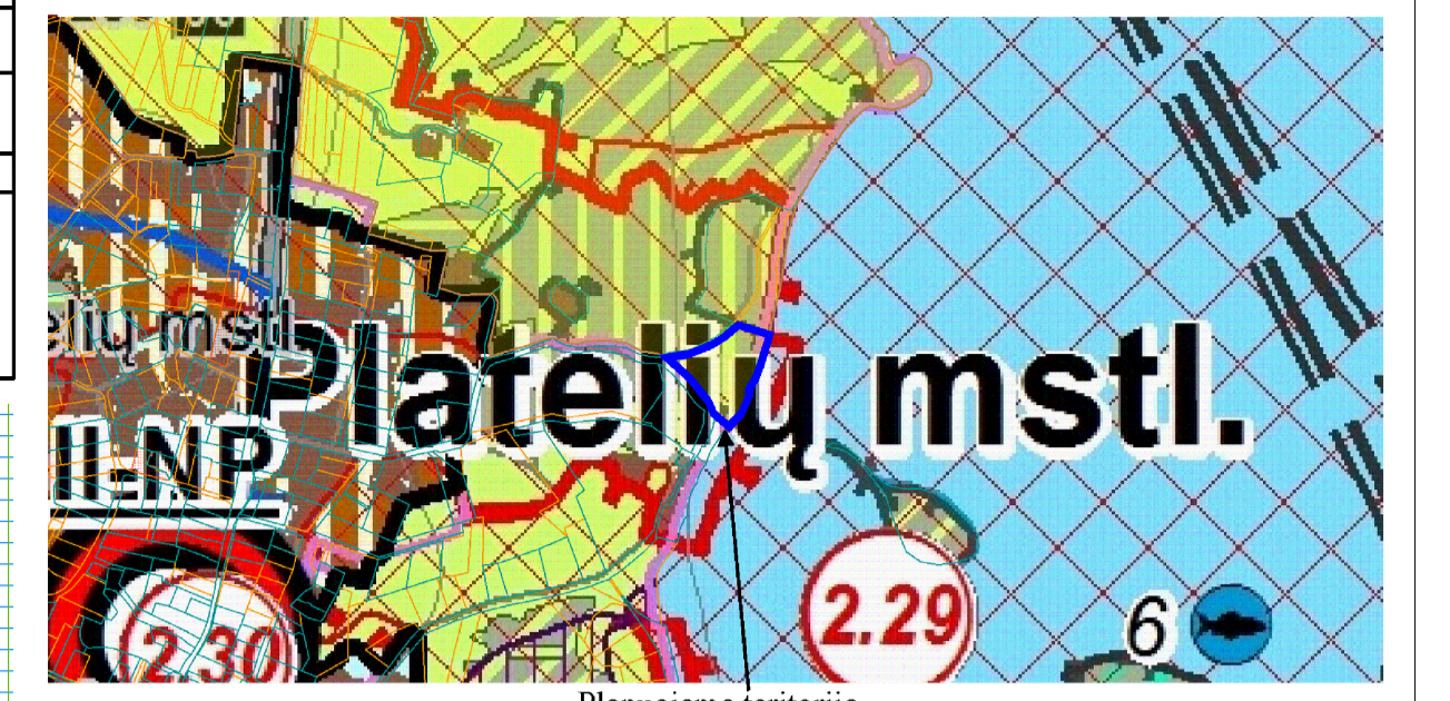
Štrauka iš 2024-03-28 Plungės rajono savivaldybės tarybos sprendimu Nr. T1-74 patvirtinto Plungės rajono savivaldybės teritorijos bendrojo plano keitimo pagrindinio brėžinio