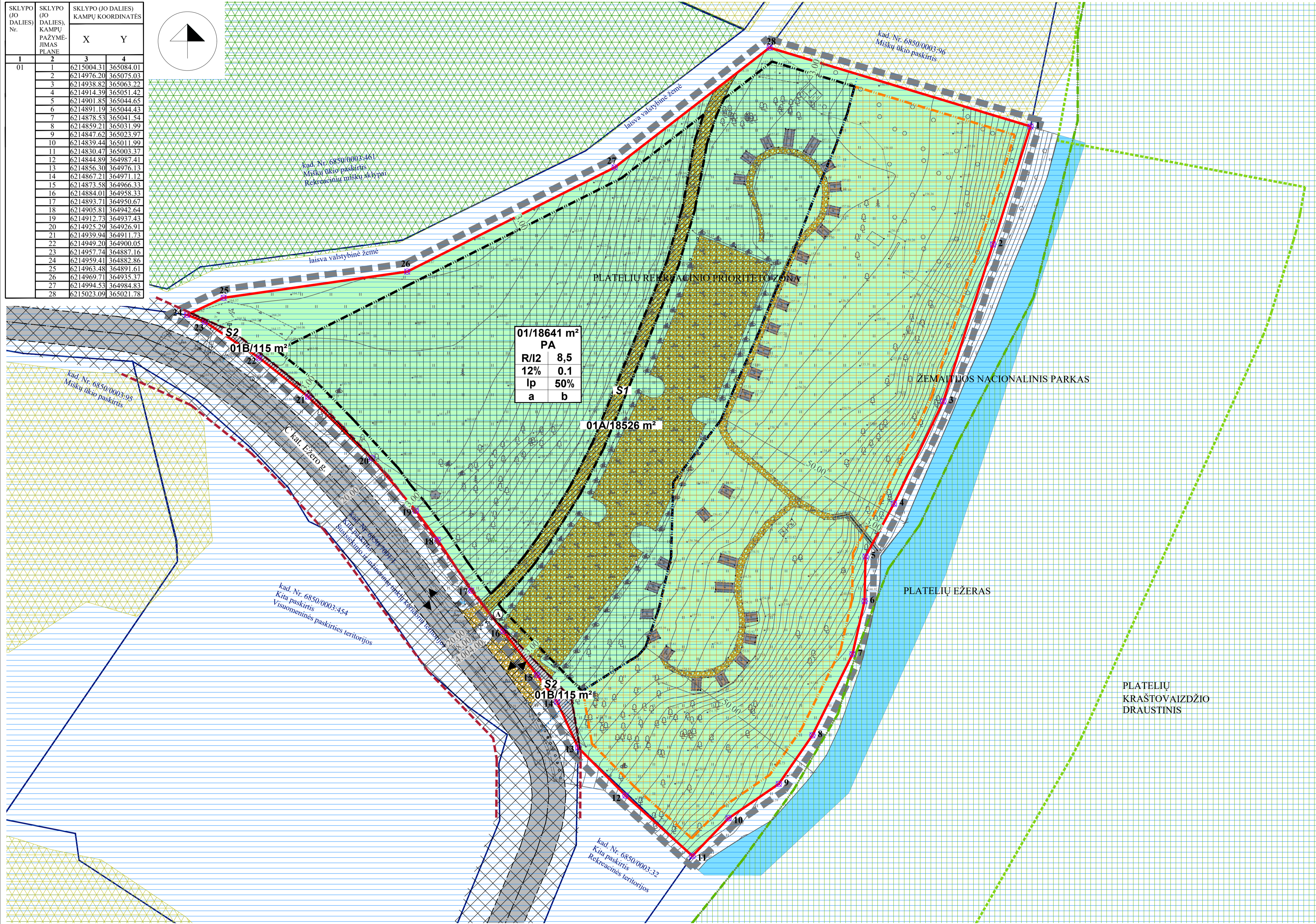
Štrauka iš 2018-07-26 Plungės rajono savivaldybės tarybos sprendimu Nr. T1-150 patvirtinto Plungės rajono savivaldybės teritorijos bendrojo plano koregavimo, žemės naudojimo ir apsaugos reglamentų brėžinio