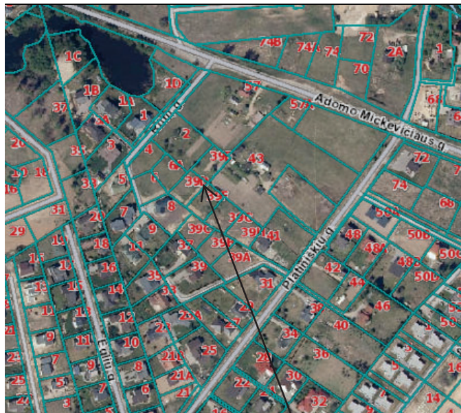
Situacijos schema. Objekto vieta.