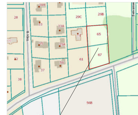
Planuojami žemės sklypai