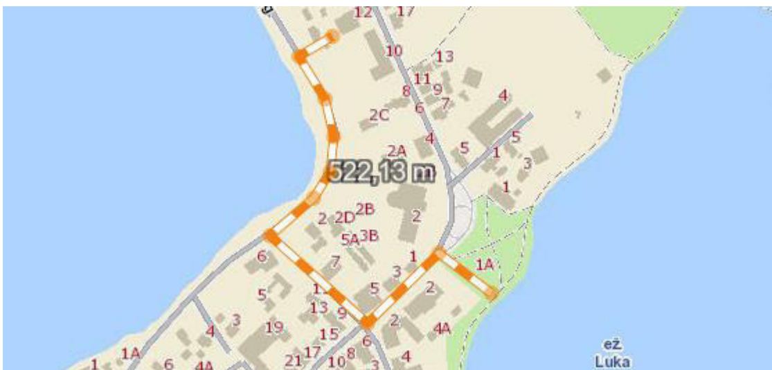
Pav. 5 Važiavimo kelias nuo ugniagesių/gelbėtojų komandos iki rekonstruojamo pastato.

Atsižvelgiant į gyvenamojoje vietovėje vienu metu kilusių gaisrų skaičių, gyventojų skaičių, pastato tūrį bei pastatų užstatymo aukštį gaisrų gesinimui iš išorės numatomas 10 l/s vandens debitas.