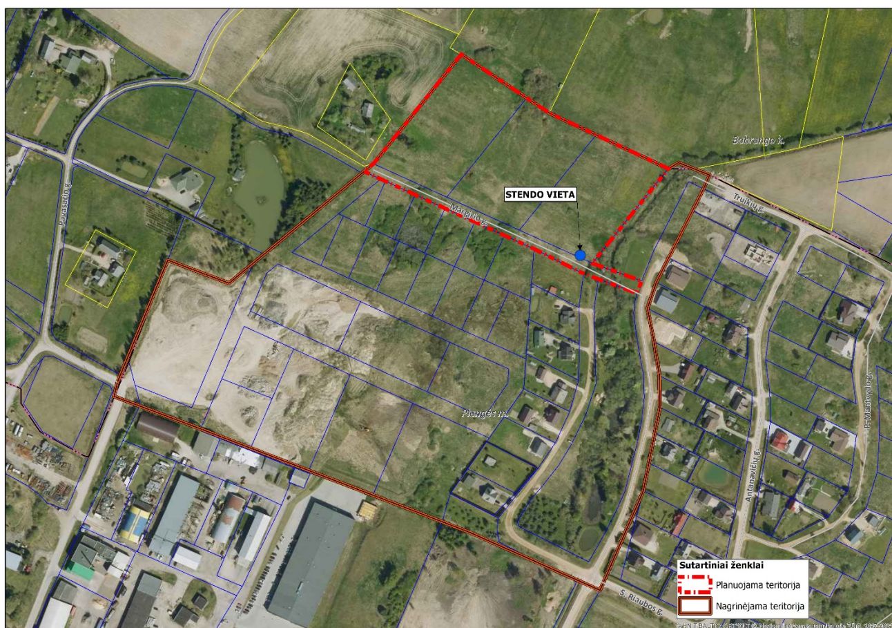
2 pav. Informacinio stendo vieta.

20.2. detaliojo plano iniciatorius yra atsakingas už informacinio stendo įrengimą, priežiūrą viso detaliojo plano proceso metu. Taip pat turi užtikrinti informacinio stendo vizualinius, turinio ir konstrukcinius kokybės reikalavimus. Informacinis stendas turi būti pagamintas iš aplinkos poveikiui atsparių ir kokybiškų medžiagų. Informaciniame stende pateikiama informacija (tekstinė ir grafinė dalis) ne mažesniame kaip A2 formato lape (594 x 420 mm), kad tilptų visa Lietuvos Respublikos teritorijų planavimo įstatyme ir Visuomenės informavimo, konsultavimo ir dalyvavimo priimančios sprendimus dėl teritorijų planavimo nuostatuose, patvirtintuose Lietuvos Respublikos Vyriausybės 1996 m. rugsėjo 18 d. nutarimu Nr. 1079, nurodyta skelbtina informacija. Informacija stende turi būti pateikta aiškiai, įskaitomai ir be gramatinių klaidų. Informacinis stendas turi būti įrengiamas 2 pav. „Informacinio stendo vieta“ nurodytoje zonoje, įvertinus konkrečios vietos inžinerinius tinklus, susisiekimo komunikacijas, reljefą, esamus želdinius ir statinius.